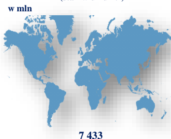
Ludność świata w 2016 r. (stan w dniu 1.I)

a bez Hawajów zaliczonych do Ameryki Północnej. b łącznie z europejską częścią Turcji. c łącznie z azjatycką częścią Rosji.