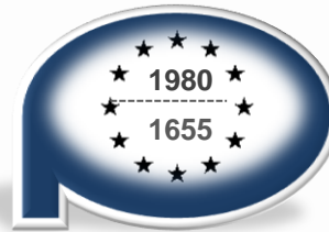
Program Operacyjny Kapitał Ludzki