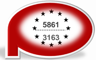
Regionalne Programy Operacyjne Województw