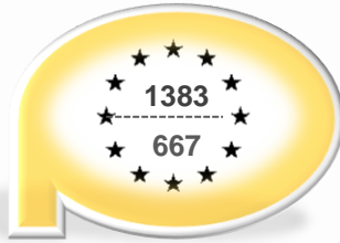
Program Operacyjny Innowacyjna Gospodarka