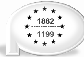
Program Operacyjny Polska Wschodnia