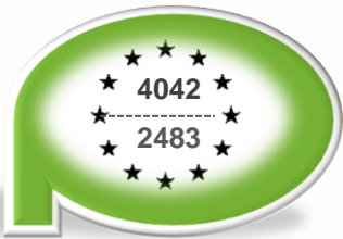
Program Operacyjny Infrastruktura i Środowisko

Wartość całkowita oraz dofinansowanie ze środków UE projektów realizowanych w ramach NSRO 2007-2013 na terenie woj. świętokrzyskiego do końca 2015 r.* w mln zł